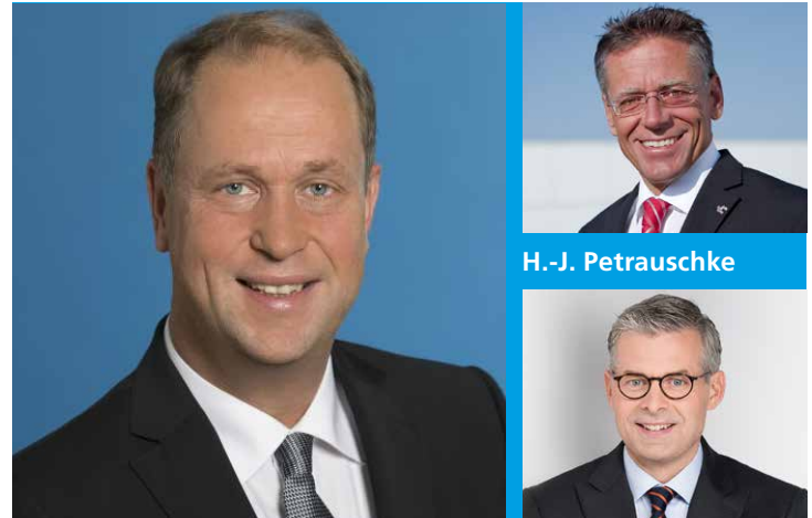
Dr. Joachim Stamp