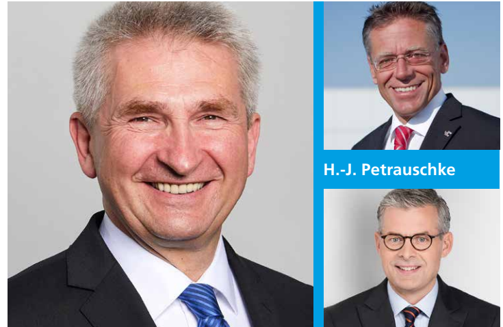
Prof. Dr. Andreas Pinkwart