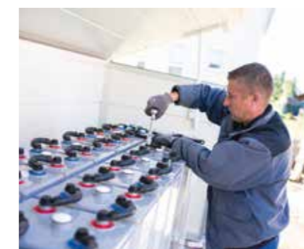
Bild links: Photovoltaik-Kollektoren können auf dem Dach und/oder der Fassade montiert werden.

Je nach vorhandenem Heizsystem unterscheidet man bi- bzw. multivalente Speicher, Kombispeicher und Schichtenspeicher.