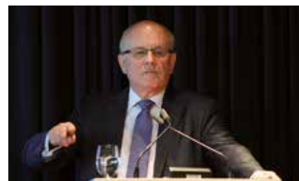
Mehr privates Engagement, weniger staatliche Vorgaben. Das war die Botschaft von Volker Kauder.