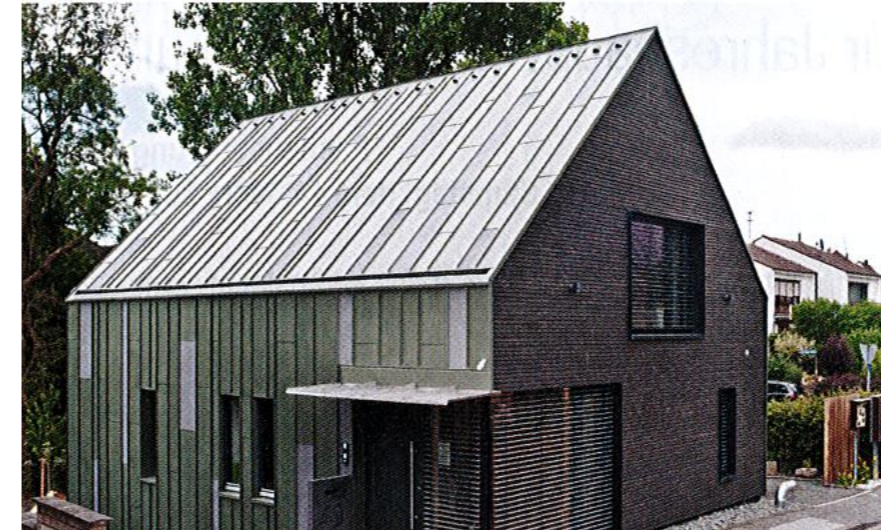
Molorest qui non eruptatur, qui tem il lignatur am re nessimus doluptas demollu

exerempore pa dunt odi re esequi dolupti officia derro que venis ra porepro ex enam dolorru ptaepudam velic temporerro ma dolupta sin eum id min non exces erion explici endignate reprempossin parum el mo experor ionsequaes aliqui volorit, sequis dolorem postio qui blam la vollacea dolut andunti buscipsus solore, suntur aut.