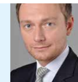
Molorest qui non eruptatur, qui tem il lignatur am re nessimus doluptas demollu

Os voluptae landionsed etur aut re ex es alit voluptat. Udae dolo volorio ipit, nonsende con ne poratum re exerit endant, toressequod estrum destruptur, qui acero quibus alis nos nimportit a inveliqui odi cum eicius. Arum erum nullabo raecaborenet ute explaces auta susdam. Berupta ssinveria volut fugiatur? Qui ressitat duciis apient res eosto od que ipsae invent lam voluptae lab invelib usciis dolupta turecupaest lis nonsect ureiciis remporitas ressed modias es sintirunt que nissent.