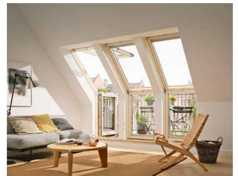
Ein Kompromiss aus Dachterrasse, Gaube und Balkon: Der Dachbalkon.

Anschließend geht es an die Dämmung der Dachflächen und Giebel, denn ohne Wärmedämmung ist komfortables Wohnen im Dachgeschoss nicht möglich. Aufeinander abge-