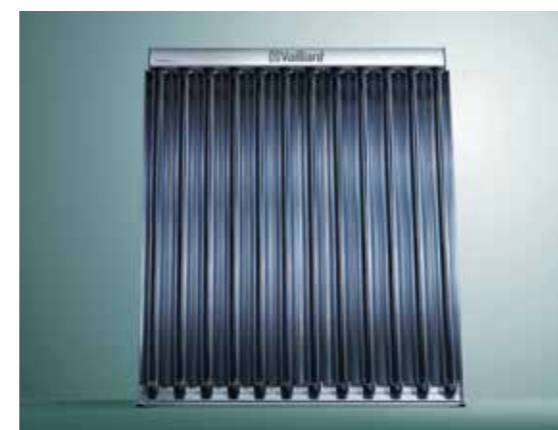
Röhrenkollektoren erzielen höhere Erträge und benötigen weniger Platz.

Röhrenkollektoren erzielen einen wesentlich höheren Ertrag und haben einen geringeren Platzbedarf. Für die Kombination aus Heizungsunterstützung und Warmwasserbereitung reichen beispielsweise rund drei bis vier Quadratmeter pro Person. Ihr Anschaffungspreis liegt über dem der Flachkollektoren. Die innenliegende Flüssigkeit, ein Wasser-Frostschutz-Gemisch, wird durch Absorption, also Aufnahme der Strahlungsenergie, aufgewärmt.