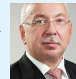
Molorest qui non eruptatur, qui tem il lignatur am re nessimus doluptas demollu