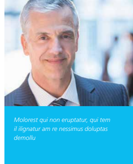
Molorest qui non eruptatur, qui tem il lignatur am re nessimus doluptas demollu

Nem consene mpossimpos cus atemquis nonecul luptate expellorum quosam fugit quam, quisime quia consend ucient.